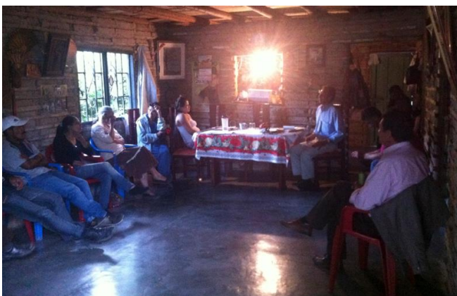
Figura 5. Asamblea - Comunidad Santa Bárbara.

La comunidad no conoce los mecanismos constitucionales para exigir sus derechos debido a que desconocen la capacidad que tiene la acción de tutela como herramienta primordial de los pueblos indígenas.