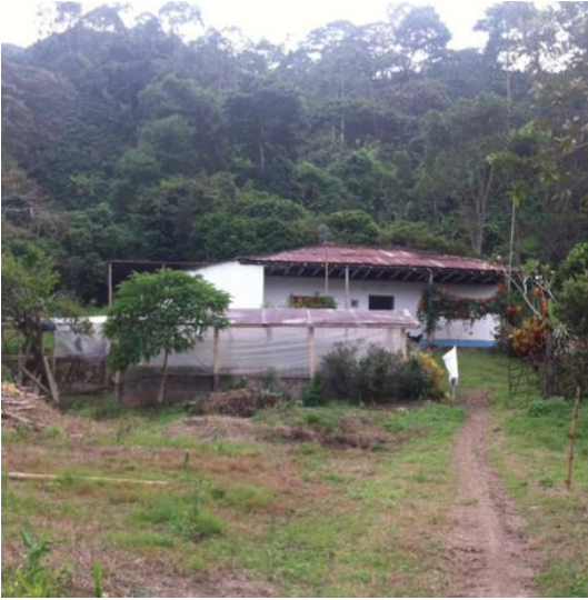
Figura 1. Vivienda tradicional Comunidad Santa Bárbara.

La accesibilidad a la comunicación es precaria en algunas, debido a que en gran parte de la región no existe cobertura alguna de ningún tipo de telefonía celular, lo que genera un aislamiento parcial, a pesar de la cercanía con el casco urbano. La vereda no posee ningún punto de comunicación interactiva.