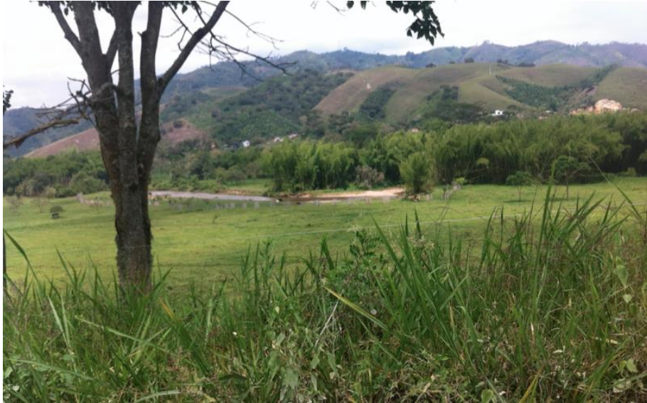
Figura 2. Vereda Santa Bárbara- Asentamiento- Comunidad Santa Bárbara.