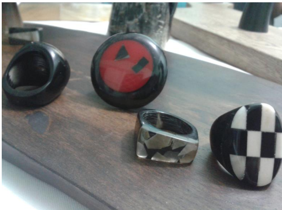
Figura1. Artesanías a base de cuernos de vaca. Tomada por Plan de Salvaguarda Pijao 2014.

pueblo Pijao. En esa misma dirección la comunidad plantea la creación de proyectos para la elaboración de instrumentos autóctonos y de danzas.